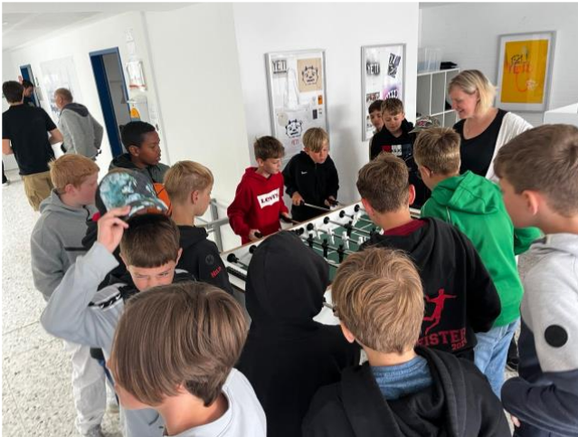
Das Eröffnungsspiel der EM